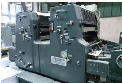
Heidelberg offset 2x красочный 48x65