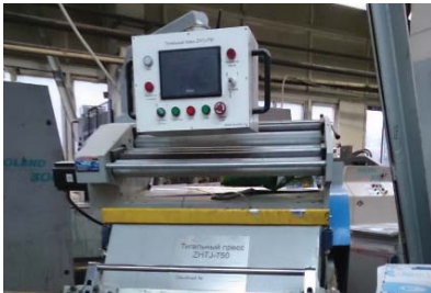
ZHTJ-750 (с тиснением)