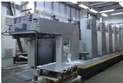
Man Roland 304, 305, 306. (A2+)