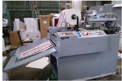
Komfi amiga A2+