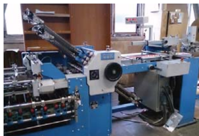
Guk 52/4 (2 шт)