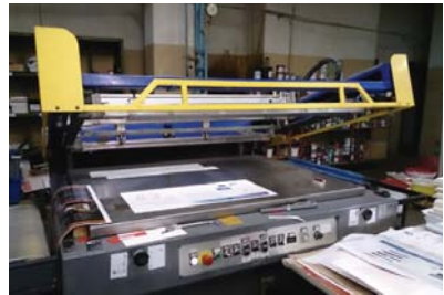
Codas Serstar A2+