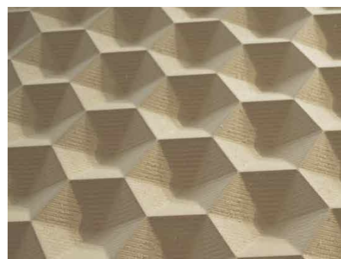
Фрезеровка 3D панелей