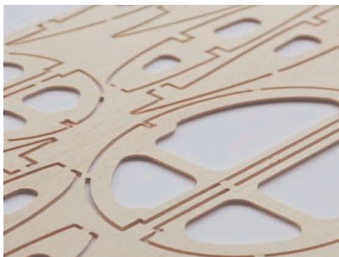
Фрезеровка контурная листовых материалов