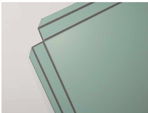
Фрезеровка композитных панелей для формирования кассет