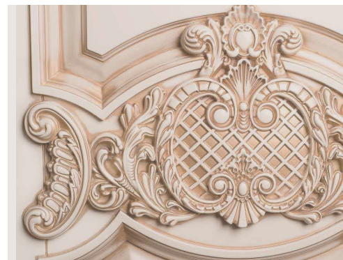
Фрезеровка фасадов и дверных накладок из МДФ