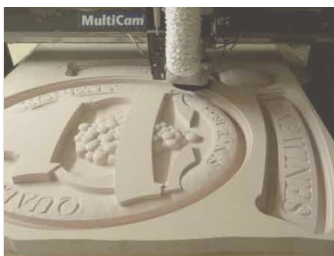
3D Фрезеровка форм для вакуумформовки