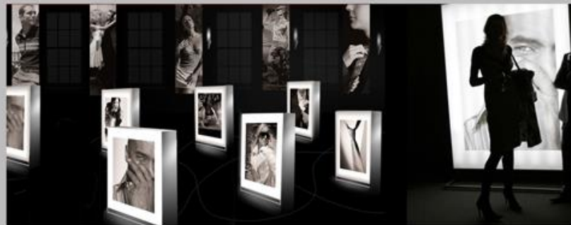
ТОРГОВЫЙ ЦЕНТР «ГИМЕНЕЙ» - ОТКРЫТИЕ. ОФОРМЛЕНИЕ ИНТЕРЬЕРА

Приглашения на открытие ТЦ «Гименей» создавались таким образом, чтобы максимально подчеркнуть элитарность центра.