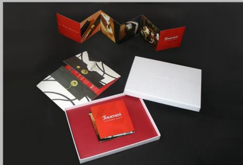
ТОРГОВЫЙ ЦЕНТР «ГИМЕНЕЙ», - ПРИГЛАШЕНИЕ